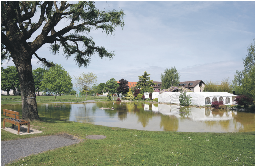
La place de Prazqueron se prépare à recevoir les festivités début juin. DOTTRENS

HÉRITAGE - L'abbaye des villageois de Romanel, Jouxkens et Vernand innove cette année en ouvrant ses portes aux femmes. Pour l'équipe d'organisation de la fête, toute jeune, c'était une évidence.